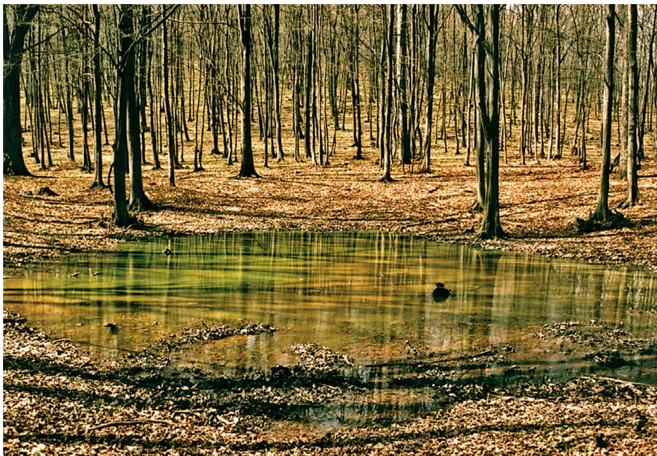
Krasové jezírko na planine Veterník je obklopeno pravěkými mohylami.

Dnes spíš hovoříme o atmosféře místa, jeho charakteru či spiritualitě. Někdy od poloviny 80. let se pojem „génius loci“ stal jedním z důležitých konceptů v architektuře, která se přeci, má-li správně fungovat, musí přizpůsobit místu a jeho náboji a ne mu vnutit svoji vůli a pak žít s místem v neustálém neklidném střetu. Ostatně nejenom v baroku, ale také v lidové architektuře všech století vidíme, že k místu je přistupováno s úctou jako ke skutečné bytosti; že stavba a krajina se doplňují a vytvářejí nový, obvykle harmonický celek. V 90. letech začal pronikat fenomén „génia loci“ do ochrany rázu krajiny. Začalo být respektováno, že na určitém území se nejenom vyskytuje určité množství chráněných živočichů a rostlin vázaných na specifický typ reliéfu, ale také, že díky vzájemnému, po tisíciletí trvajícimu soužití lidí a přírody, zde vznikla jakási nová hodnota, o kterou je nutné pečovat. Obvykle o ní mluvíme jako o rázu krajiny, o něčem jedinečném a neopakovatelném, co vtiskuje místu jeho charakter a kvůli čemu se na určité místo vracíme.