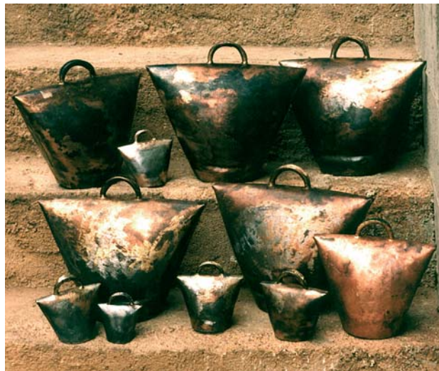
Jednoduchý geometrický tvar zvonků připomíná jak moderní umění, tak i pravěké tvary.

má díru, kterou se dmýchá vzduch. Pec naloží dřívím, koksem nebo dřevěným uhlím, které si sám vyrábí. Nejprve z plechu vytepeá zvon, jehož archaický tvar připomíná neolitické torzo monumentální figuríny. Ve výhni postavené ze šamotových cihel vyklepe ouško a srdce zvonu. Spojí všechno dohromady. Pak jde na planinu a hledá mosazné nábojnice z 2. sv. války. Vloží je do železného zvonu. Má teď problémy, protože děti nezaměstnaných rodičů nábojnice vysbíraly do sběru. Nad vsí na nepropustném krasovém podloží nakope hlínu. Smíchá ji se slámou, obalí zvon zvenku i zevnitř. Někdy zvon pokryje novinovým papírem. Dřevěným kulem udělá díru a vše vloží do pece.