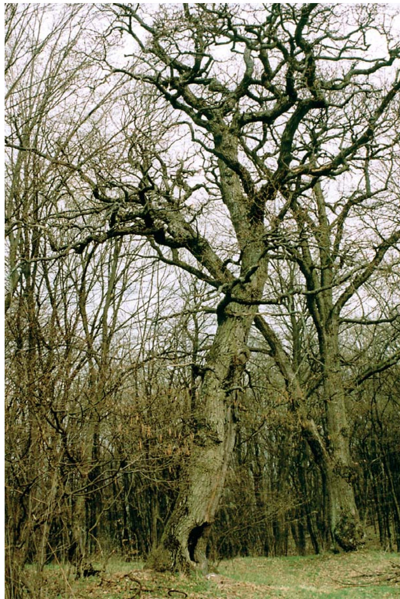
Staré hraniční duby na Silické planině.

Slovenský kras je několik krajin v jedné. U Domici a Hostovců se dotýká panonských nížin. Z rozpadlého bačovského záchodku nad Zádielom oko putuje přes nížiny až kamsi k jižním Slovanům a ke kopcům nad Bělehradem. Ale o pár kilometrů dál na Horném vrchu jsme ještě v Rudohoří, Čremošenská dolina patří středoslovenským horám, ale dolina Slané již k hornímu Podunají. Něco